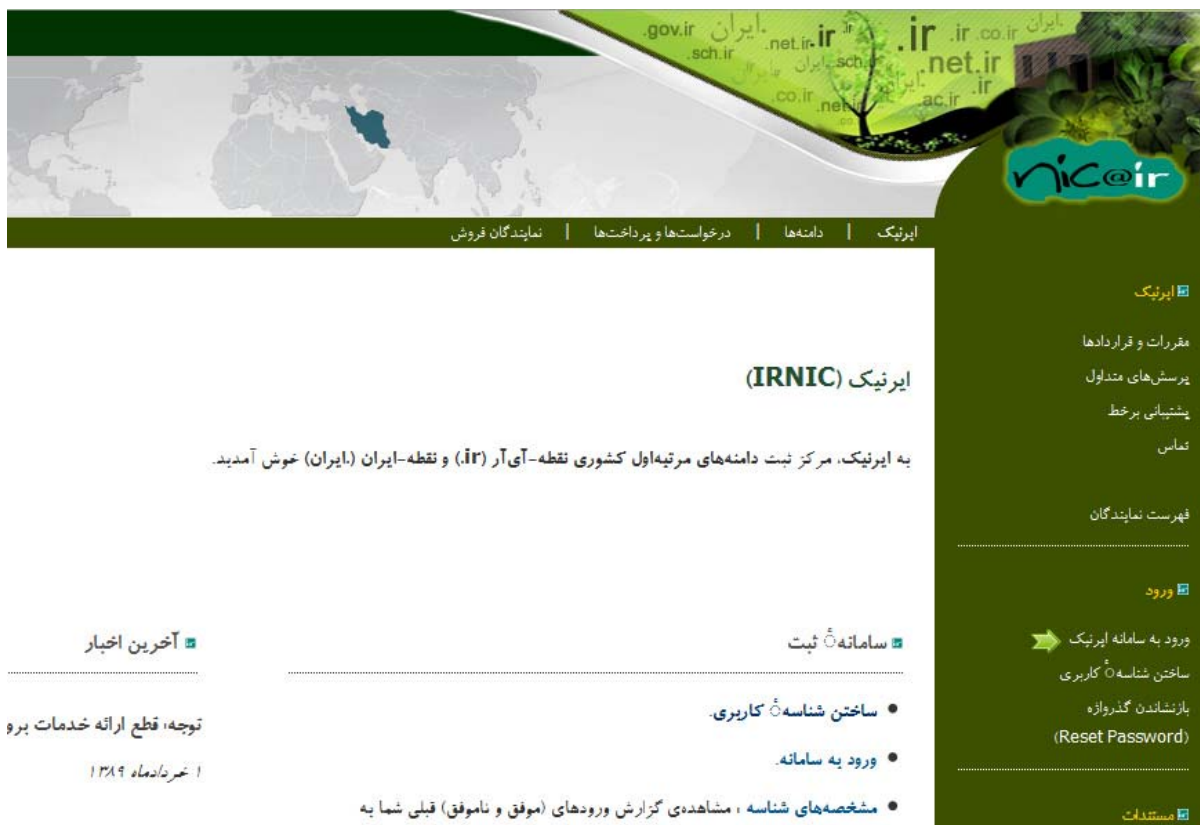
شکل - ۴

(۱) وارد سایت ایرنیک به آدرس www.nic.ir می شویم. صفحه‌ای مانند شکل ۴ - را مشاهده می کنیم.