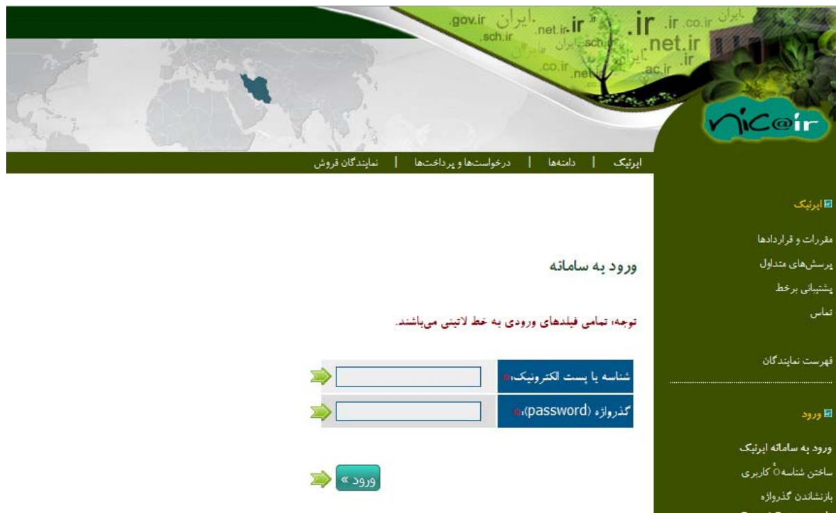
شکل - ۶

۲) وارد صفحه جدیدی مانند شکل - ۶ می شوید.